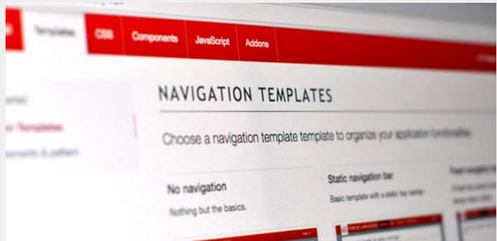
Création d'un kit UI et d'une documentation des bonnes pratiques de conception d'interface pour Generali.